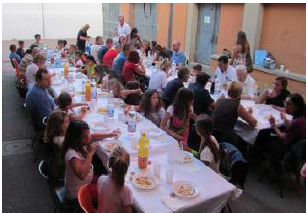
Cena al termine del Catechismo 2014