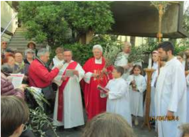
DOMENICA DELLE PALME