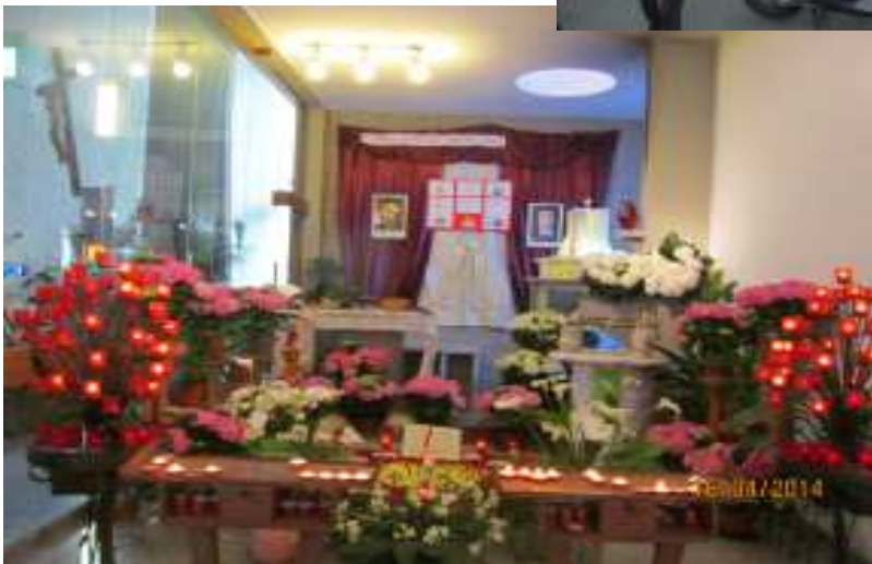
L'ALTARE DELLA REPOSIZIONE