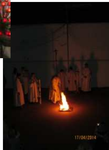
L'ACCENSIONE DEL FUOCO NELLA NOTTE DI PASQUA