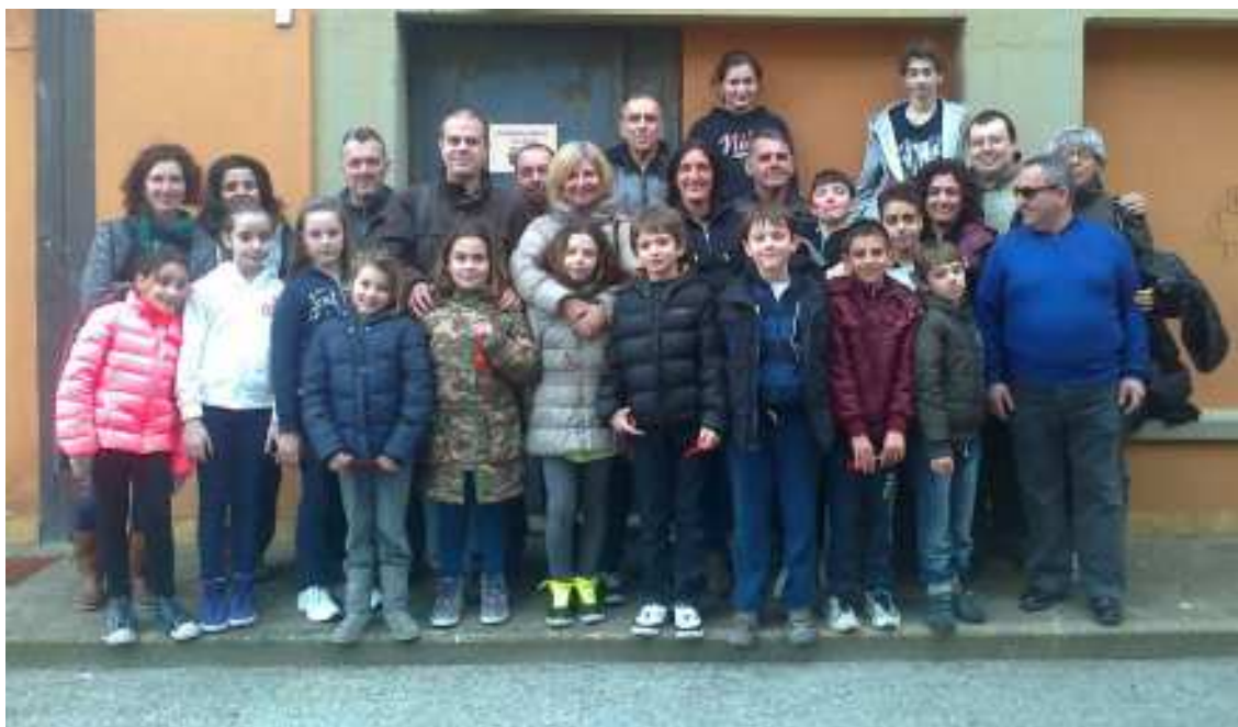
Ragazzi e genitori insieme all'Oratorio della Seton