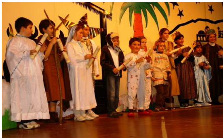
(sopra) i bambini della recita