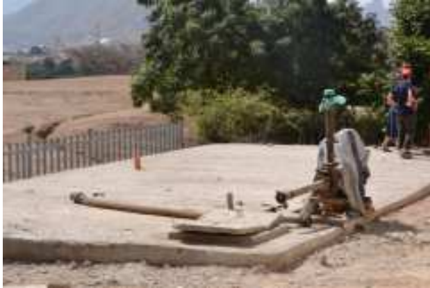
A sinistra la vasca coperta per la riserva d'acqua della Clinica di Karen