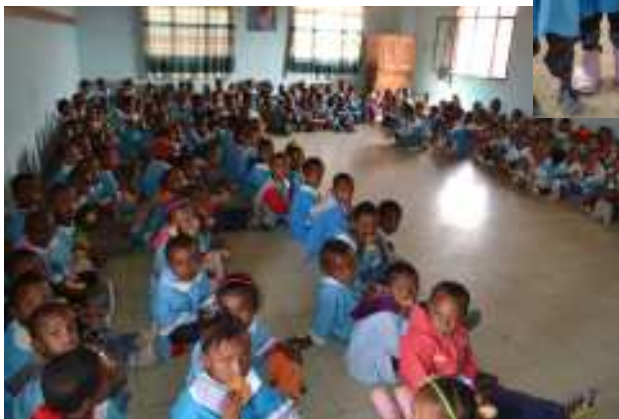
Bambini della Scuola di Dekamerè