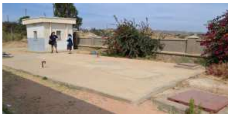
A destra la vasca coperta per la riserva d'acqua della Scuola di Dekamerè