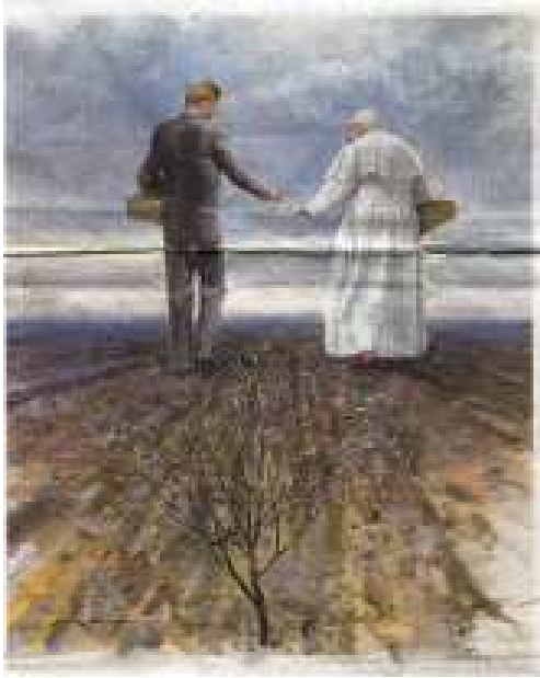
La copertina della "Domenica del Corriere" del 29/12/1963